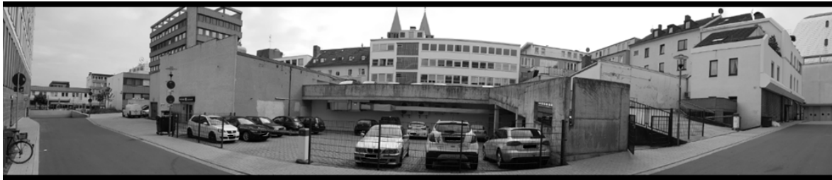
Abb. 1: Eigene Aufnahmen vom Plangebiet (Panorama, Grundstückszufahrt, Parkdeck)