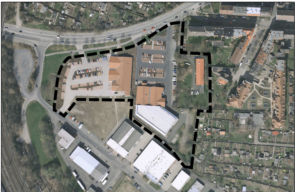
Abb. 1: Auszug aus dem Stadtatlas 2010

Erschlossen werden die Grundstücke über die Wolfhager Straße und die Angersbachstraße; sie sind über Fußwegverbindungen erreichbar und an den ÖPNV (Bushaltestelle Wolfhager Straße) angebunden.